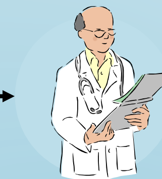
Visite de spécialiste