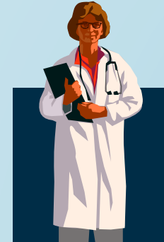
Personnel d'Accueil et d'Orientation

Musculosquelettique Vestibulaire bénin (VPPB) Chute de la personne âgée Neurologie bénigne