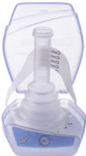
Étui pénien Conveen Optima