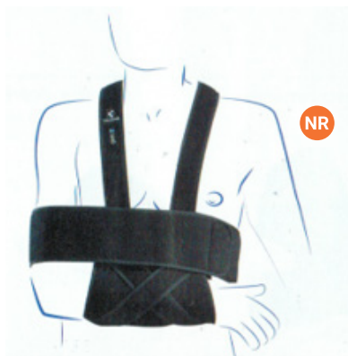
Gilet d'immobilisation scapulo-humérale Le Gilet®