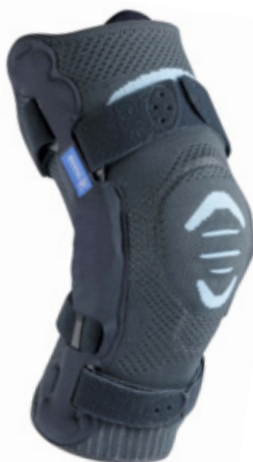
Genouillère ligamentaire articulée GenuLigaflex®