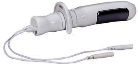
Sonde vaginale Saint Cloud plus