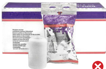
Bandes de résine