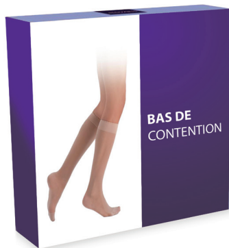
Bas de contention