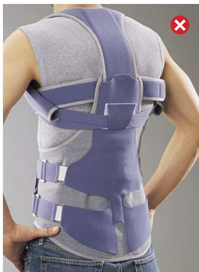
Corset de soutien du rachis LombaxDorso®