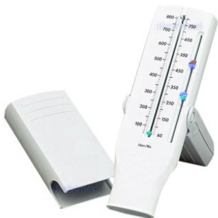
Débitmètre de pointe Personal Best