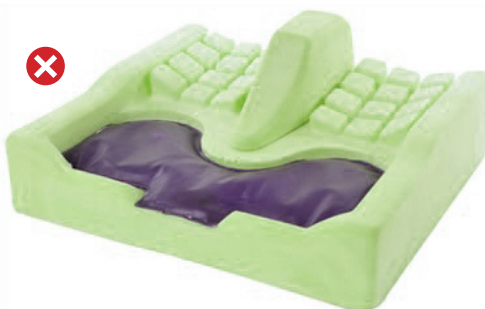
Coussin anti-escarre Mixte : mousse / gel

Les coussins anti-escarres monoblocs de type 1 et 2 ne peuvent être prescrits que s'ils sont composés de mousse. Sont exclus les coussins anti-escarres en gel, à air ou mixtes.