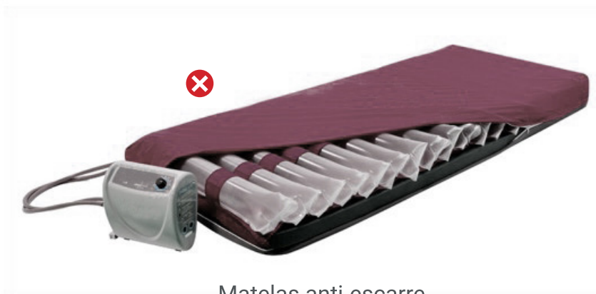
Matelas anti-escarre à air