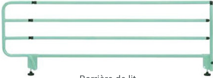
Barrière de lit