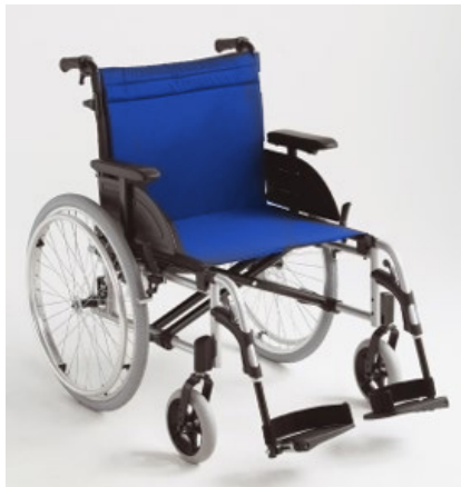
Fauteuil roulant à propulsion manuelle (classe 1)

CLASSE 1 : Propulsion manuelle CLASSE 2 : Moteur électrique CLASSE 3 : Verticaliseurs CLASSE 4 : Monte-marches