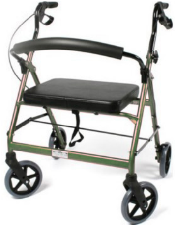
Déambulateur à propulsion manuelle