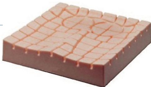
Coussin anti-escarre en mousse monobloc Type 1 et 2