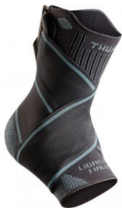
Chevillère proprioceptive et ligamentaire Ligastrap Malleo®

Cette section comprend toutes les attelles uniquement souples et amovibles. Les attelles articulées rentrent donc dans la catégorie des dispositifs prescriptibles, tout comme les appareils divers de correction.