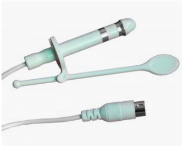
Sonde pour stimulation anale Saint Cloud

POUR ÉLECTROSTIMULATION NEUROMUSCULAIRE CONTRE L'INCONTINENCE URINAIRE