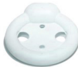
Pessaire vaginal en anneau Avec bouton Medgyn