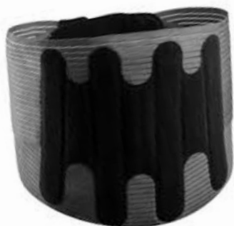
Ceinture de soutien rachis-lombaire Lombaskin®

L'ensemble des dispositifs de série sont prescriptibles, à baleines solides ou non.