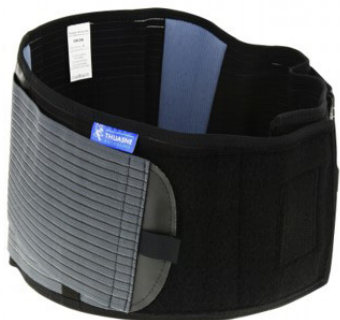
Ceinture de soutien rachis-lombaire Lombacross activity®