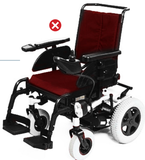
Fauteuil roulant à propulsion électrique (classe 2)