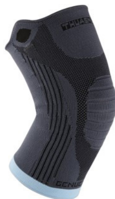
Genouillère proprioceptive GenuExtrem®