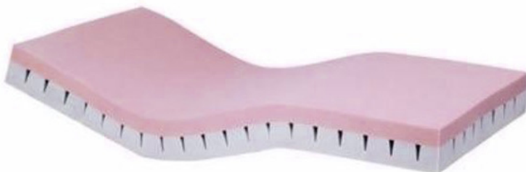
Matelas anti-escarre Type 1 et 2