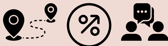
Table Ronde 2 : Quelles sont les autres actions essentielles pour optimiser l'accès aux soins ?